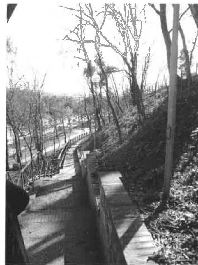
FOTO 7-8 Alberature compromesse lungo camminamento a mezzacosta