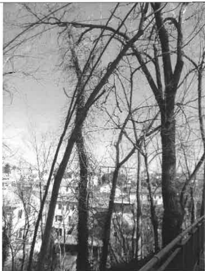
FOTO 1-2-3 Alberature secche, pericolanti e con notevole pendenza radicate nella scarpata sottostante via del Montirozzo