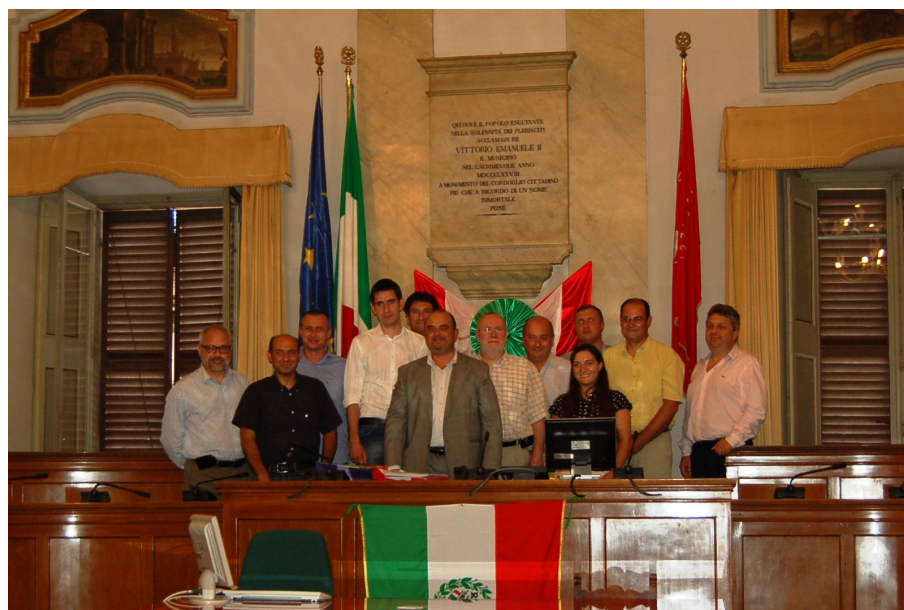
La foto di gruppo