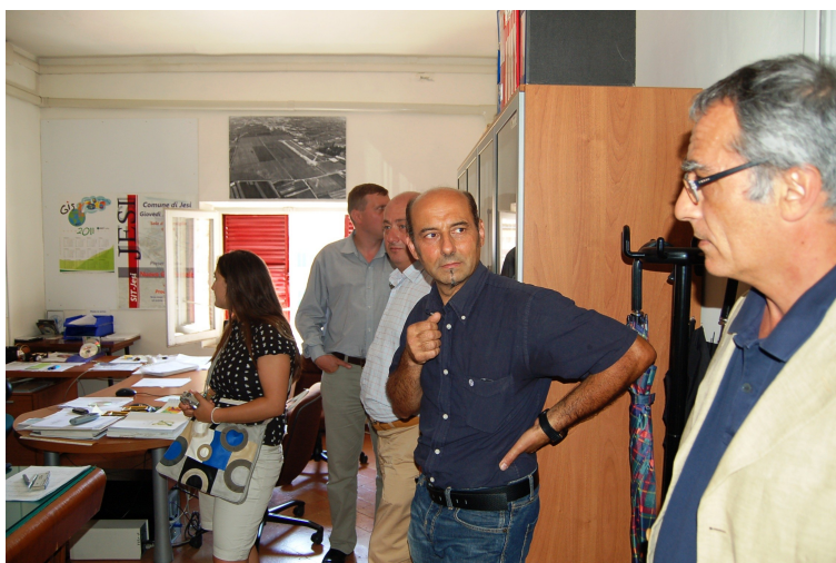
La delegazione, accompagnata dal dirigente del Servizio Urbanistica e dal Responsabile del SIT, visita gli uffici del Sistema Informativo Territoriale.