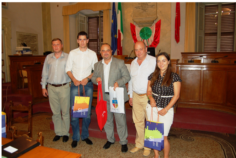
La consegna dei doni tra le Amministrazioni Rumena ed il Comune di Jesi